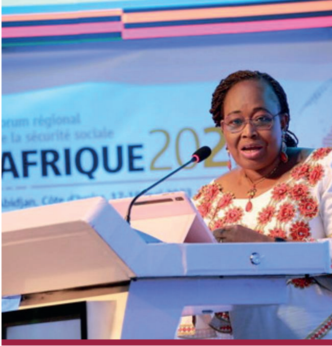
معالي السيدة ميناتا سامات سيسوما، مفوض الصحة والشؤون الإنسانية والتنمية الاجتماعية