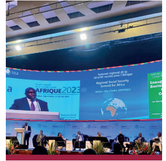
ممثل مفوضية الاتحاد الإفريقي لإدارة الصحة والشؤون الإنسانية والتنمية الاجتماعية

قامت مفوضية الاتحاد الإفريقي بقيادة سعادة السفيرة ميناتا سامات سيسوما بافتتاح منتدى التنسيق والتعاون بين مؤسسات الضمان الاجتماعي في أفريقيا للضمان (ISSA) في منتدى الجمعية الدولية للضمان الاجتماعي (ASSCCF) الذي عقد في 19 مايو 2023 بمدينة أبيدجان (RSSF) الاجتماعي الإقليمي في ساحل العاج.