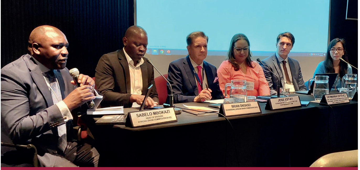
المشاركون في اجتماع تعزيز نظم معلومات سوق العمل والهجرة باستخدام البيانات الآنية والمنهجيات الجديدة.

نظمت مفوضية الاتحاد الأفريقي جلسة موازية حول تعزيز سوق العمل ونظم معلومات الهجرة ببيانات آنية ومنهجيات جديدة خلال المنتدى الدولي الثالث لإحصاءات الهجرة الذي عقد في لجنة الأمم المتحدة الاقتصادية لأمريكا اللاتينية بمدينة سانتياغو في تشيلي، من 24 (UNECLAC) ومنطقة البحر الكاريبي إلى 26 يناير 2023. نُظِم المنتدى الثالث لإحصاءات الهجرة 2023 من قبل إدارة الأمم المتحدة للشؤون الاقتصادية والاجتماعية وإدارة الإحصائيات والسكان، ومنظمة التعاون الاقتصادي والتنمية، والمنظمة الدولية للهجرة .