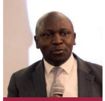
JLMP المشاركون في إطلاق إجراءات العمل والتوظيف والتنقل للمشروع الرئيسي

أطلقت مفوضية الاتحاد الأفريقي ومنظمة العمل الدولية والمنظمة الدولية للهجرة والمجموعات الاقتصادية الإقليمية والدول الأعضاء مشروعًا جديدًا مدته ثلاث سنوات؛ ويهدف مشروع «البرنامج المشترك بين الاتحاد الأفريقي ومنظمة العمل الدولية والمنظمة الدولية للهجرة واللجنة الاقتصادية لأفريقيا حول إدارة هجرة إلى تعزيز «JLMP Lead) العمالة من أجل التنمية والاندماج في إفريقيا حوكمة العمالة والتشغيل والتنقل في القارة الأفريقية