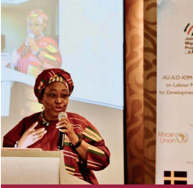
معالي السيدة ميناتا سامات سيسوما، مفوض الصحة والشؤون الإنسانية والتنمية الاجتماعية