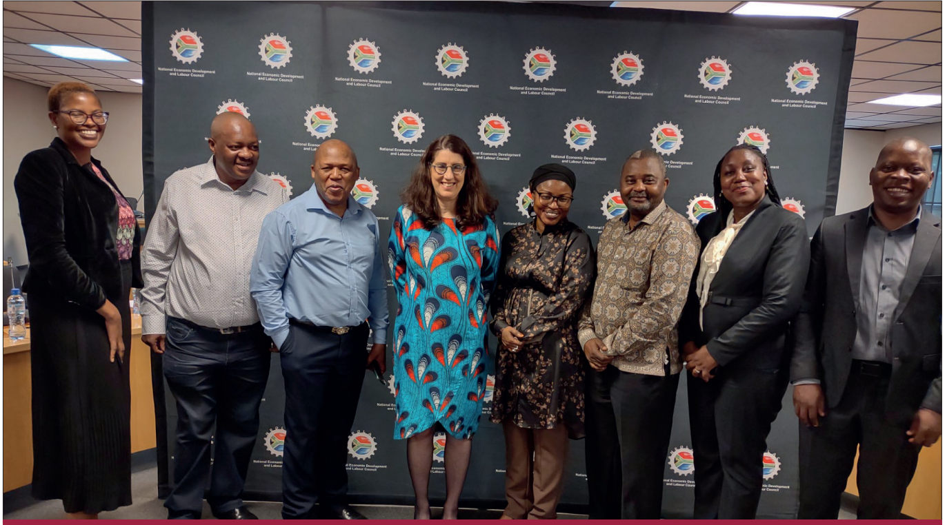
صورة ممثلي مفوضية الاتحاد الأفريقي - قسم العمالة والتوظيف والهجرة. مع ممثلي المجلس الوطني للتنمية الاقتصادية والعمل: حقوق الطبع والنشر © 2023 مفوضية الاتحاد الأفريقي. جميع الحقوق محفوظة

عقدت مفوضية الاتحاد الأفريقي، مسترشدة برؤيتها المتمثلة في "أفريقيا متكاملة ومزدهرة وسلمية، اجتماعاً ليوم واحد في 16 مارس 2023 مع أمانة المجلس بمدينة جوهانسبرغ في جنوب (NEDLAC) الوطني للتنمية الاقتصادية والعمل إفريقيا، وكان هدف الاجتماع هو تبادل المعلومات حول العمل والتشغيل وحوكمة الهجرة، وتعزيز التشاور بشأن السياسات بين أصحاب المصلحة المتعددين والتنسيق العملي.