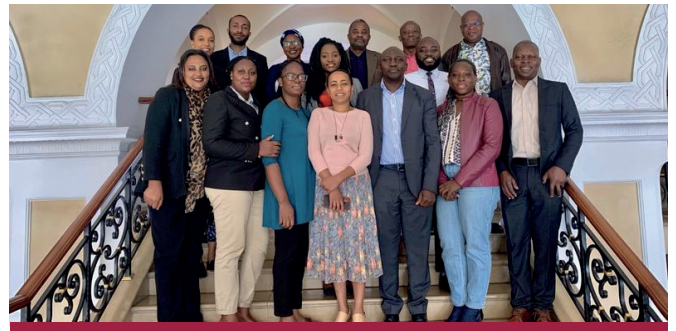
أعضاء مفوضية الاتحاد الأفريقي - قسم العمالة والتشغيل والهجرة.